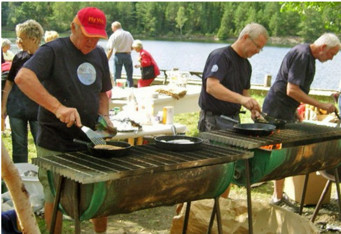
Lördagen den 18 augusti avhölls för elfte gången Vimmans dag i Lunnevik, Ånimskog. Vackert väder, gott humör och delikat vimma som här steks av glada entusiaster. Andrén och c;o i full aktion vid pannorna.